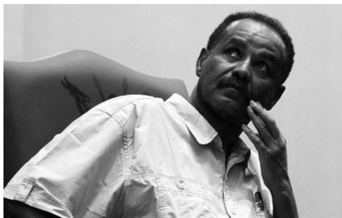
"... ነዚ ውድብ መንዲሎም ንሮሞ።"