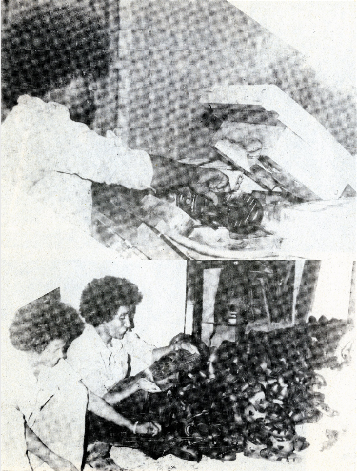
ንድርብ መጥቃዕቲታት ዝውዕሉ 6,000 ኮንጎ ብEPRP ብምስጢር ኣብ ማኻይን ተጻዒኖም ካብ ሳኡል ናብ ትግራይ ትራንስፖርት ተገብሩ።